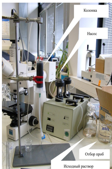
Рисунок 3 – Экспериментальная установка для изучения процесса связывания ЛПС с КРШ в непрерывном режиме (в колонке)

Изучение кинетических параметров связывания ЛПС в условиях проточной колонки (рисунок 3) показало, что эффективность извлечения ЛПС из растворов колоночным методом значительно выше, чем при использовании стационарных условий. Такие результаты открывают хорошие перспективы для развития методов эфферентной терапии вообще.