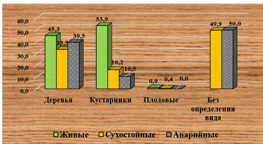
Рисунок 2 – Оценка жизненного состояния зеленых насаждений г. Аксу (%)

могут выявить критические факторы внутри городской среды, тогда как количественные оценки могут выявить районы городов, лишенные преимуществ городских зеленых насаждений [13].