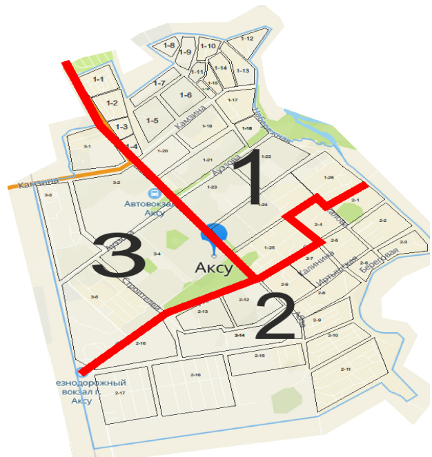
Рисунок 1 – Участки инвентаризации зеленых насаждений г. Аксу

При проведении инвентаризации для удобства учета древесных и кустарниковых насаждений территорию города разделили на три участка (рисунок 1). Первый участок располагался в северо-восточной части города (246 га), второй участок – в южной (334 га), третий – в северо-западной (229 га). Обследование осуществляли маршрутно-визуальным методом с качественной оценкой и количественным подсчетом.