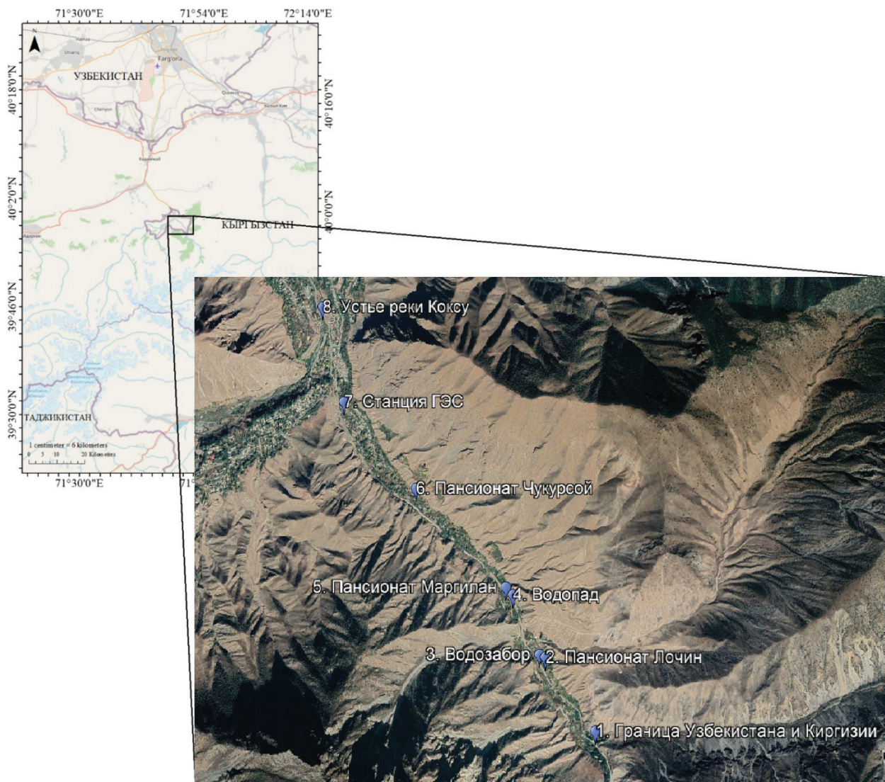
Рисунок 1 – Географическое расположение экклава Шахимардан (слева) и космический снимок бассейна реки Коксу (высота н.у.м. – 1514 м – 1311 м) с указанием точек исследования ихтиофауны.

В 2021 году исследования были проведены 4 экспедиции в зону реки Коксу в течение июля, августа, сентября и ноября месяцев с применением рыболовных сетей и мордушек, а в 2022 году с также применяли сертифицированные ранцевые электро-рыболовные инструменты Honda FEG 1500, 1.8 кВт, на применение которых было получено официальное разрешение государственного Комитета Республики Узбекистан по экологии и охране окружающей среды (письмо №03-02/1-711 от 01.04.2022). Данный инструмент не оказывает никакого вредного влияния на рыб. Наоборот, он предотвращает гибели рыб из-за травмирования или удушья при применении рыболовных сетей, позволяя при этом проводить быстрый и эффективный