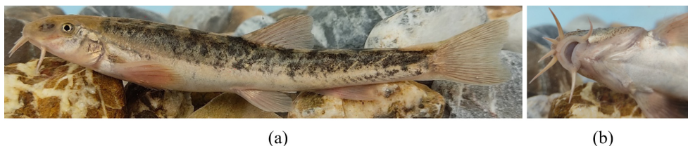
Рисунок 3 – Nemachilus sp. найденный в реке Коксу (а) и ее ротовой аппарат (b).

В связи с тем, что температура в реке Коксу была выше ( 9.5^{\circ}\text{C} ) и количество пойманных рыб было значительно больше, чем после слияния с рекой Аксу ( 7.7^{\circ}\text{C} ), мы предполагаем, что более высокая температура Коксу может являться более подходящей средой для зимования маринки и может играть ключевую роль в ее жизненном цикле. Кроме того, постоянные расходы и стабильно более высокая температура воды приводит к развитию кормовой базы реки Коксу в течение даже зимних периодов, что привлекает рыб к миграции в эту речную систему. Устранение двух полных миграционных барьеров: бетонного водораспределительного сооружения и искусственного водопада высотой около 3.5 м в русле реки Коксу приведет к еще большему увеличению ее значения для популяций рыб. Это предположение может быть научно подтверждено после дальнейшего отслеживания миграции рыб в будущем.