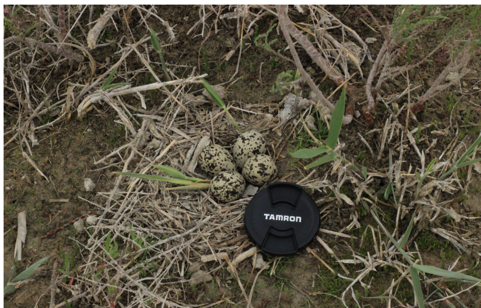
Рисунок 3 – Гнездо белохвостой пигалицы Vanellochettusia leucura на озере Картма