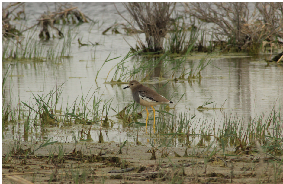
Рисунок 2 – Белохвостая пигалица Vanellochettusia leucura на озере Картма

Сезонную динамику количественного состава белохвостой пигалицы, зарегистрированной во время проведения учетов птиц на озере Картма с 2014 по 2019 гг. можно проследить в приводимой (табл. 1).