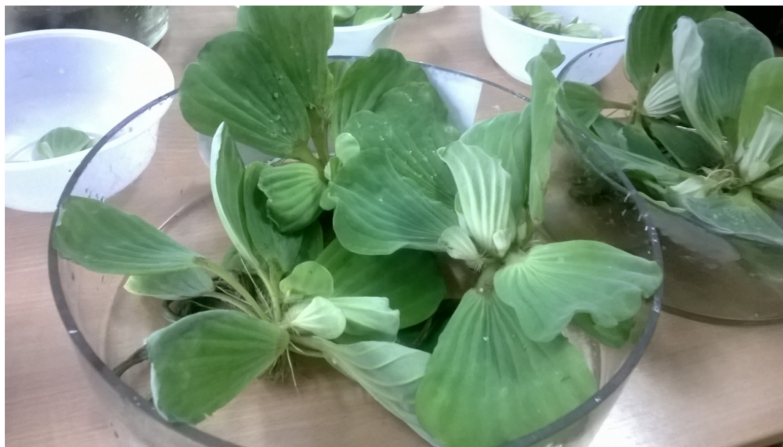
2-сурет – Тәжірибе соңына дейін өсірілген Pistia stratiotes (31 күн арасы)

Алынған нәтиже бойынша Zn, Cu – ауыр металдардың мөлшері ШРЕК-нан төмен көрсеткішті көрсетті. Cd – ауыр метал мөлшері 0,26 мг/л, ШРЕК мөлшерінен 260 есе жоғары. Ал, Pb-0,010 мг/л концентрациясы ШРЕК мөлшерінен 3 есе төмен екенін көрсетті.