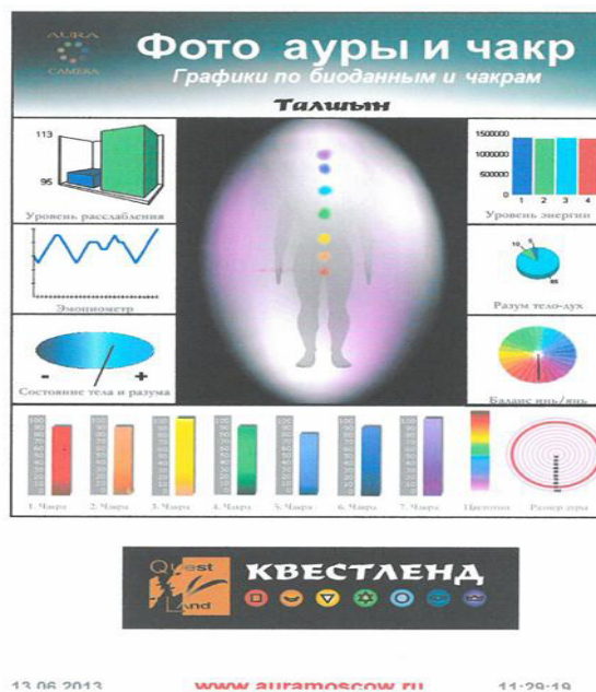
Сурет 2 – Ем қабылданғаннан кейінгі 20 жастағы студенттердің аурасы мен чакрасы

Аураның сапасы ақпарат көзіне байланысты, ал ақпарат әрекеттің пайда болуына байланысты, яғни сөздер, сезімдер, ойлар және армандар жиналып, туындайды және оның аурасында осының барлығы қамтып көрсетіледі. Егер де аура тұтастай жағымсыз болса, онда болашақта физикалық жағдайы бұзылады, себебі «жаман» аура адамның физикалық денесіне кері әсерін тигізуі мүмкін. Ал аура мен чакра бір-бірімен тығыз байланыста. Осылайша қабылданған ақпарат көзінен адамның ішкі энергетикалық күші күшейді.